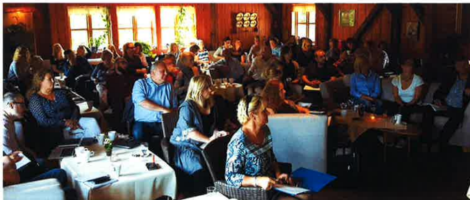
«Stinn brakke» på fellessamling på Karlsvik Gård i august 2017.