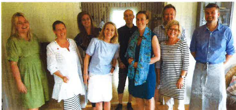
Nytt team 2017 – sosiale entreprenører

Gründernetverket skal være best på etablering, tilrettelegging, vedlikehold og fasilitering av læringsnettverk for gründere og ledere i småbedrifter. I Gründernetverkets gründerteam lærer og trener entreprenører ledelse, organisering og forretningsprosesser.