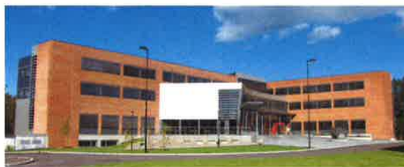
Silicia, Raveien 205, 3188 Borre