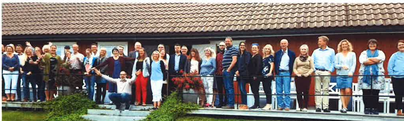
Fra fagsamlingen på Karlsvik Gård i samarbeid med teknologiinkubatoren Silicia – august 2017