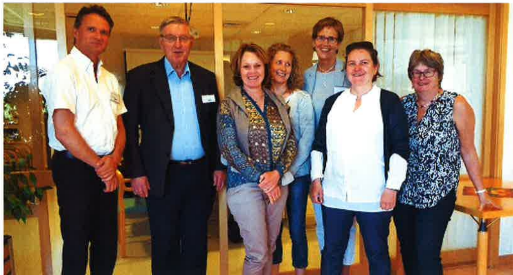
Fungerende styre i Gründernettverket sammen med daglig leder

Gründernettverkets tilbud ledes av en daglig leder (DL) i 60% stilling. DL rapporterer til et styre som er stiftelsens øverste organ. Styret, sammen med DL, utgjør også valgkomiteén når nye styremedlemmer velges. I hvert team av gründere utnevnes det en teamleder og DL følger jevnlig opp disse. Det gjennomføres egne teamledermøter og de følges også opp ved jevnlig dialog pr mail, telefon og individuelle møter.