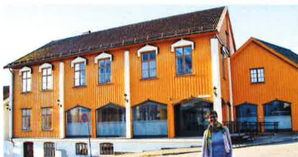
Colab, Brannvaktsgt 5, 3264 Larvik

Virksomheten har hatt daglig leder ansatt i 60 % stilling hele året. Arbeidsmiljøet anses som godt, og et godt samarbeid med aktørene i «Vekst i Vestfold» er viktig. Daglig leder jobber svært selvstendig og har bred kompetanse og stort nettverk. Hun er god til å tenke framover og initiere gode prosjekter for videreutvikling. DL flyttet i september inn i nytt kontor i «Huset for nyskaping»; Colab Larvik. DL får fortsatt disponere kontor plass og møterom hos Silicia i Forskningsparken, Campus Vestfold. Det har ikke vært arbeidsrelaterte skader eller ulykker i 2017. Vi har hatt en person i arbeidspraksis fra NAV siden juni 2017.