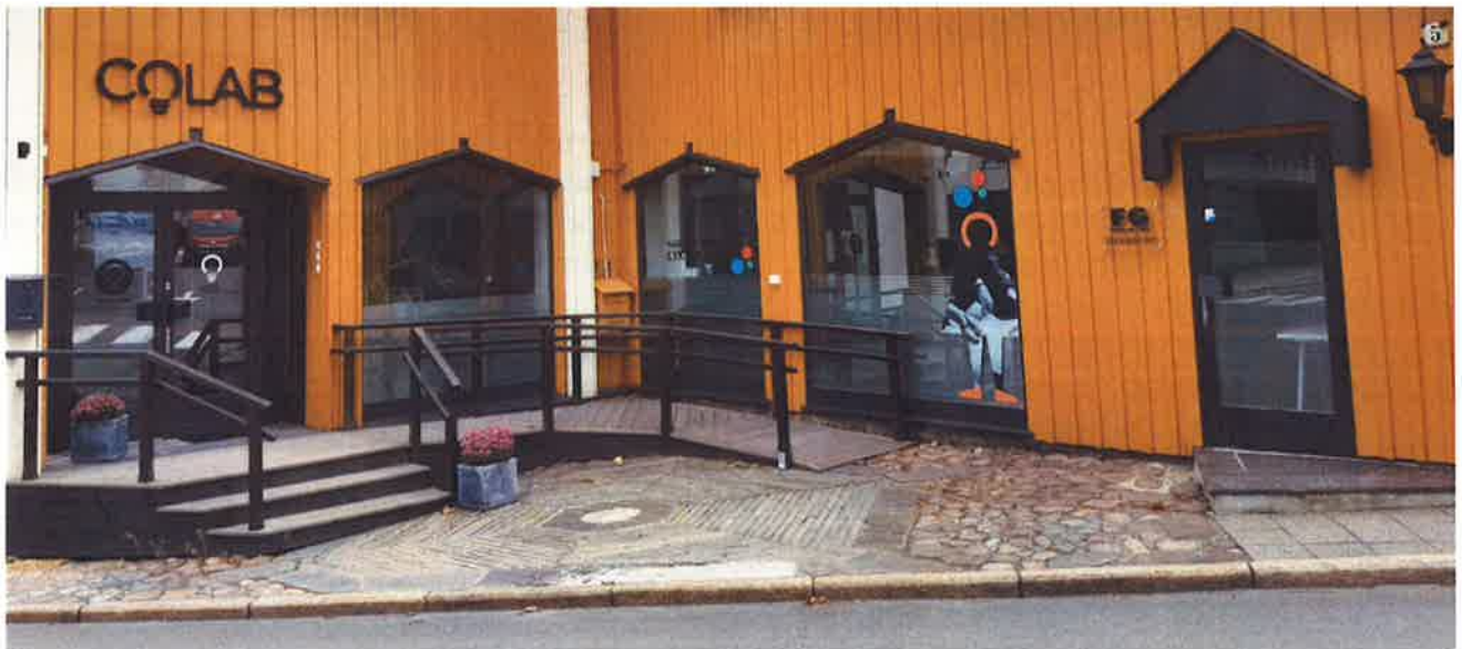
COLAB LARVIK – DER GRÜNDERNETTVERKET LEIER KONTOR

Det har ikke vært arbeidsrelaterte skader eller ulykker i 2017. Eneste ansatte er daglig leder i 60 % stilling. DL jobber svært selvstendig og har bred kompetanse og stort nettverk. I løpet av året har hun også bidratt i i Silicia i ca 20% prosjektstilling. Siden oktober 2018 har hun bidratt i et engasjement i Colab Larvik og START i Larvik, grunnet en permisjon. Dette gir en flott oversikt over de øvrige entreprenørskapstilbudene i Vestfold, noe som har vist seg nyttig for flere gründere i form av «matchmaking». Gründernettverket leier kontor hos Colab Larvik. I tillegg får DL fortsatt disponere kontorplass og møterom hos Silicia i Forskningsparken, Campus Vestfold. Det er et bedret samarbeid i Vekst i Vestfold-gruppen i løpet av 2018.