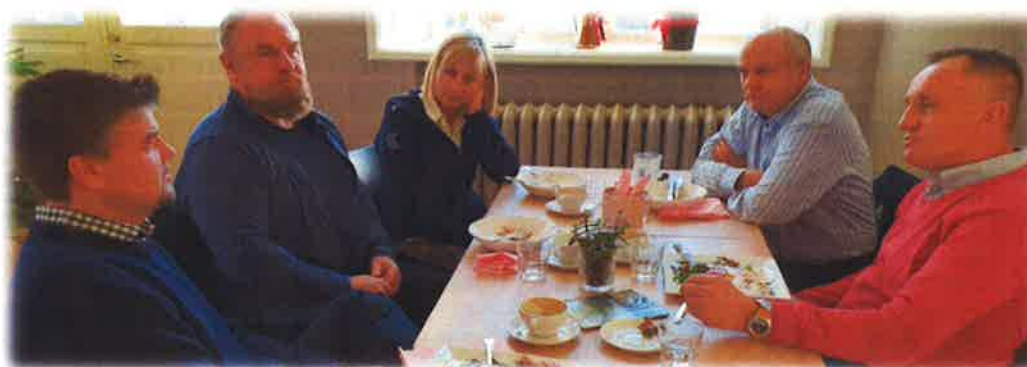
Teamledere i Gründernettverket på et av de kvartalsvise møtene. Side