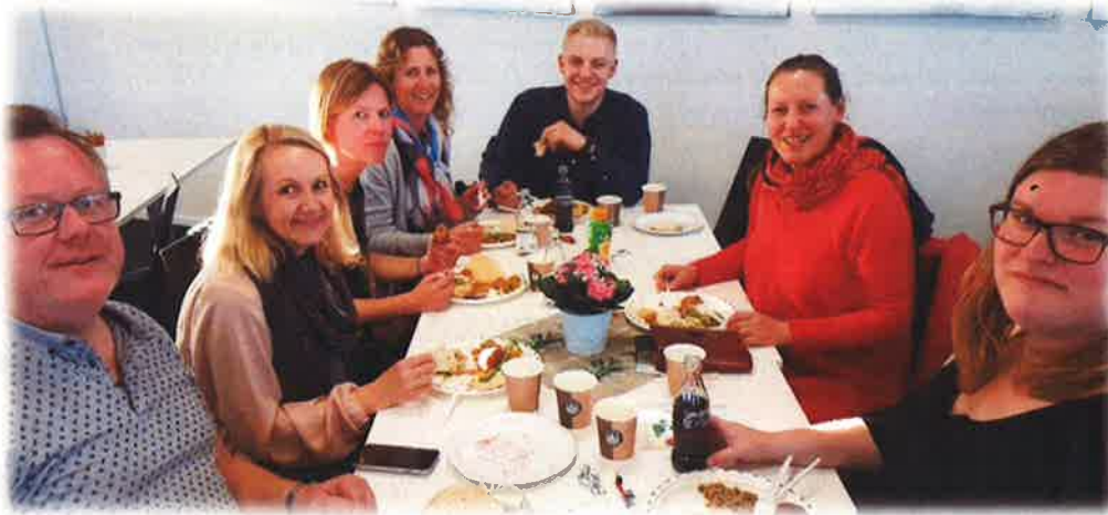
Fra årsmøte i Gründernettverket 24.4.2018

Pr 31.12.18 bestod medlemmene i Gründernettverket av 39 kvinner og 24 menn. Vi har stort alderssprik og medlemmene representerer mange ulike bransjer. Nye entreprenørskapsformer/forretningsmodeller er representert; så som sirkulær økonomi og sosialt entreprenørskap.